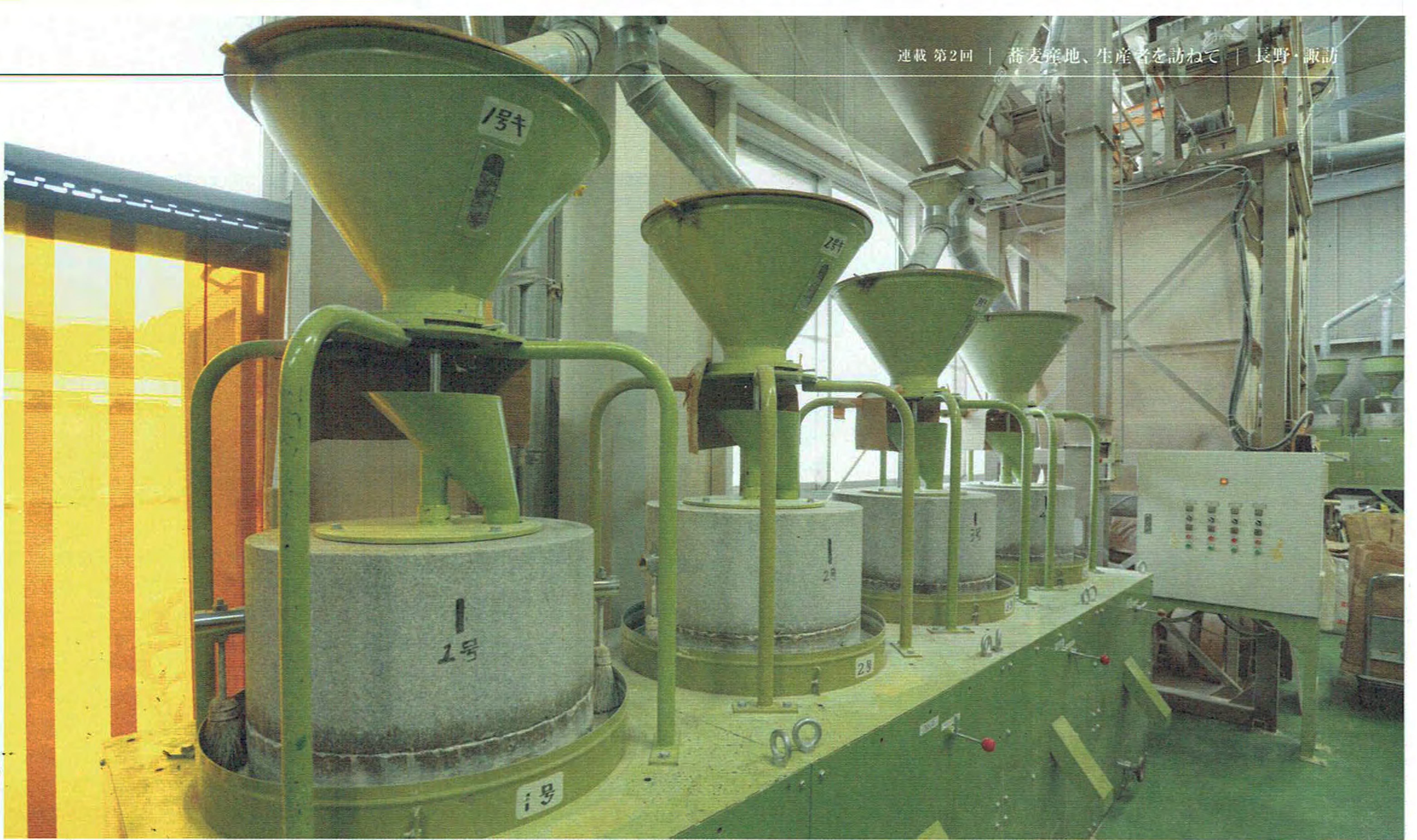
高山製粉の工場の中では60台の石臼が低い音を響かせて回り続けている。石臼は1台ずつ大きさが異なり、回転数もさまざま。個々の石臼の能力や特性にふさわしい粉が挽けるように調節されて使われている。これらの石臼から、全国のそば好きが笑顔になるおいしいそば粉が挽き出される。

で、高山製粉のそば粉の評判が高い。高山製粉の名前は、そば打ち愛好家の間ではすでに秀でたブランドとして確立しているように見える。しかしなぜ、この会社のそば粉は特別なものとして評価されるのだろうか。